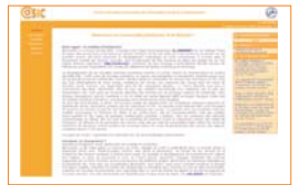
Plate forme d'information riche avec consultation de documents (pdf) par domaine, types, date de parution, par auteur ...